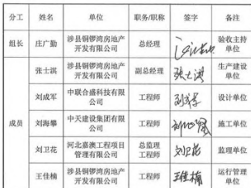
防洪排导工程分部工程验收组成员签字表