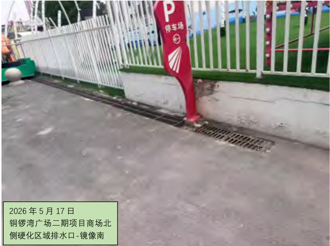
2026年5月17日 铜锣湾广场二期项目商场北 侧硬化区域排水口-镜像南